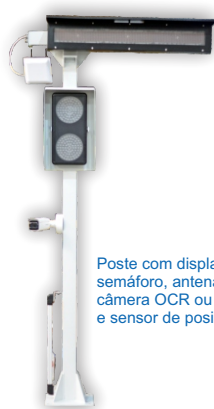
Poste com display, semáforo, antena RFID, câmera OCR ou Fototicket e sensor de posicionamento.