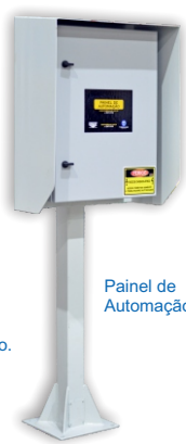
Painel de Automação

O sistema habilita tanto forma manual como de forma automática onde, pela forma manual, o operador faz o controle dos equipamentos disponíveis na automação (semáforos, cancelas e displays).